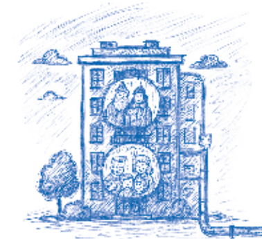
Если ваша батарея холодная, обратитесь в УК