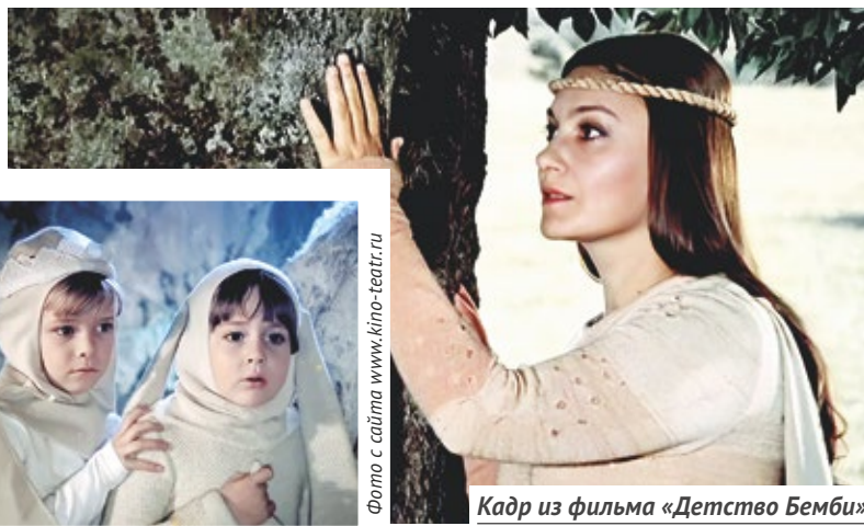
Кадр из фильма «Детство Бемби»

«Приехали мы на съёмки в государственный заповедник в районе Алушты. В один из съёмочных дней мы в буквальном смысле застряли: на заповедник опустился «стальной» туман. Я не видела ничего на расстоянии вытянутой руки. А под нами пропасть. Тут я говорю в мегафон: «Осторожно идём на мой голос». И все пошли вереницей ко мне. Мы сели в автобус, спустились ниже и оказались среди муфлон. Там мы познакомилась с чудесным егерем, который пустил нас переночевать. А в четыре утра мы встретили рассвет и сняли удивительные кадры», — вспоминает режиссёр.