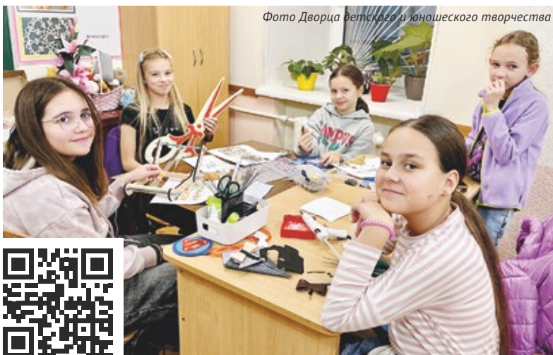
Фото Дворца детского и юношеского творчества