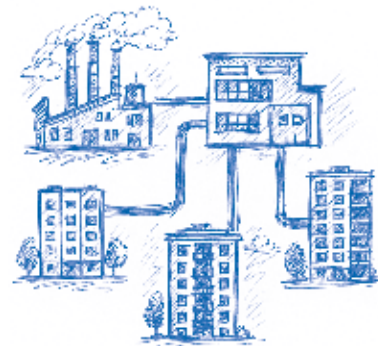
Из котельной тепло к домам поступает от трёх до 12 часов