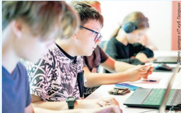
Фото центра «IT-куб. Гагарин»

Центр цифрового образования «IT-куб. Гагарин» приглашает юных севастьяпольцев на бесплатные занятия.