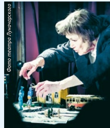
Фото театра Луначарского

Постановку можно будет увидеть 14 декабря на малой сцене театра. Начало в 19:00. Возрастное ограничение 12+.