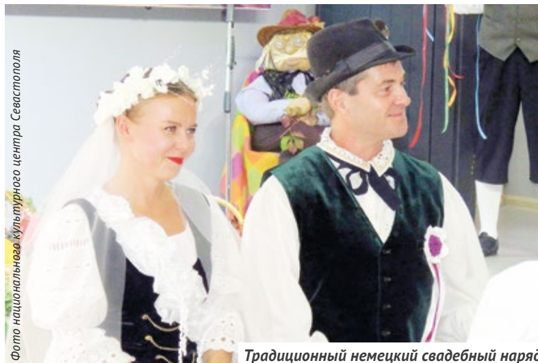
Традиционный немецкий свадебный наряд