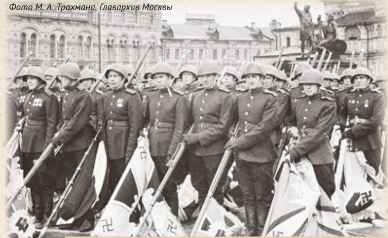
Колонна офицеров Красной армии на параде Победы 24 июня 1945 г. с поверженными фашистскими знамёнами

От Знамени Победы по всей длине была оторвана полоска шириной три сантиметра. По разным данным, её на сувенир забрал себе наводчик «Катюши», штурмовавший Рейхстаг, или работники политотдела 150-й стрелковой дивизии.