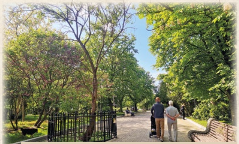
На Малаховом кургане растёт старый миндаль — мемориальное дерево, пережившее Великую Отечественную войну

4 ноября 1959-го открыта диорама «Штурм Сапун-горы 7 мая 1944 года» — грандиозное батальное сооружение, для которого художникам позировали сами герои сражения, а предметный план состоит из подлинников.