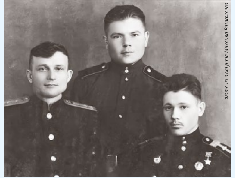
Фото из аккаунта Михаила Развожаева

Историями боевого пути своих дедов и прадедов — участников Великой Отечественной войны поделился губернатор Севастополя Михаил Развожаев.