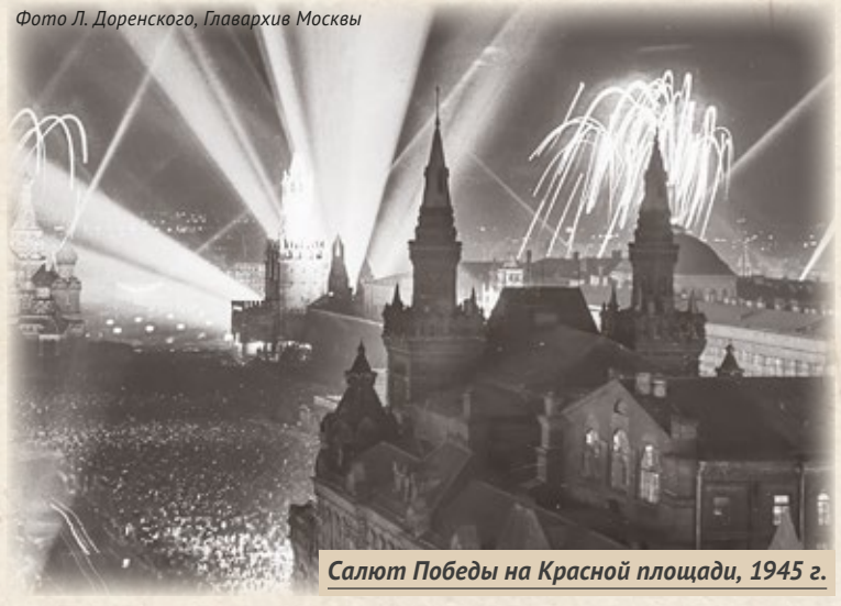
Салют Победы на Красной площади, 1945 г.