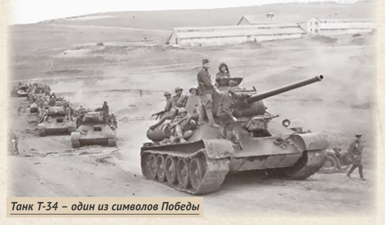
Танк Т-34 — один из символов Победы