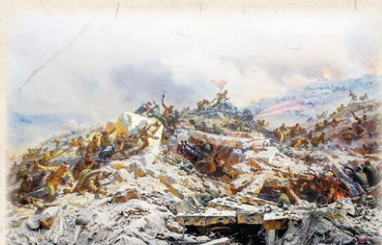
Фрагмент полотна диорамы «Штурм Сапун-горы 7 мая 1944 года»

На последнем прорвавшемся в город корабле «Ташкент» эвакуировали в Новороссийск более двух тысяч человек и панораму «Оборона Севастополя 1854–1855 гг.» Франца Рубо.