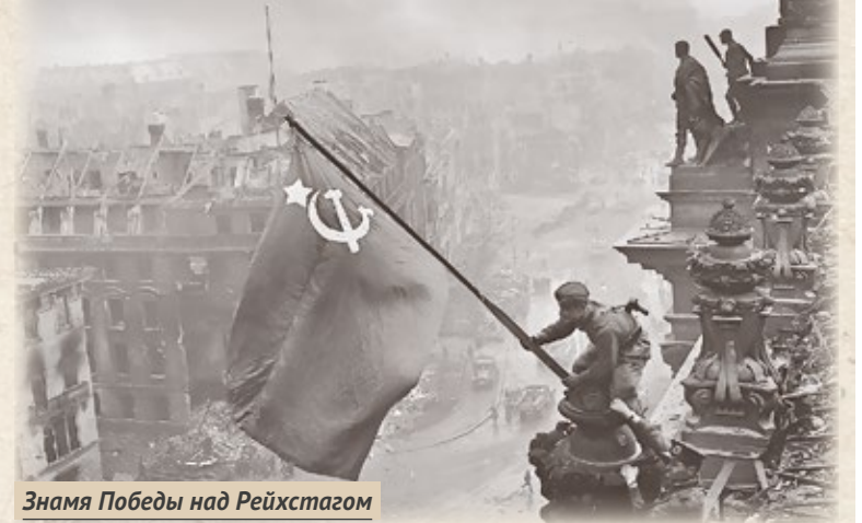
Знамя Победы над Рейхстагом