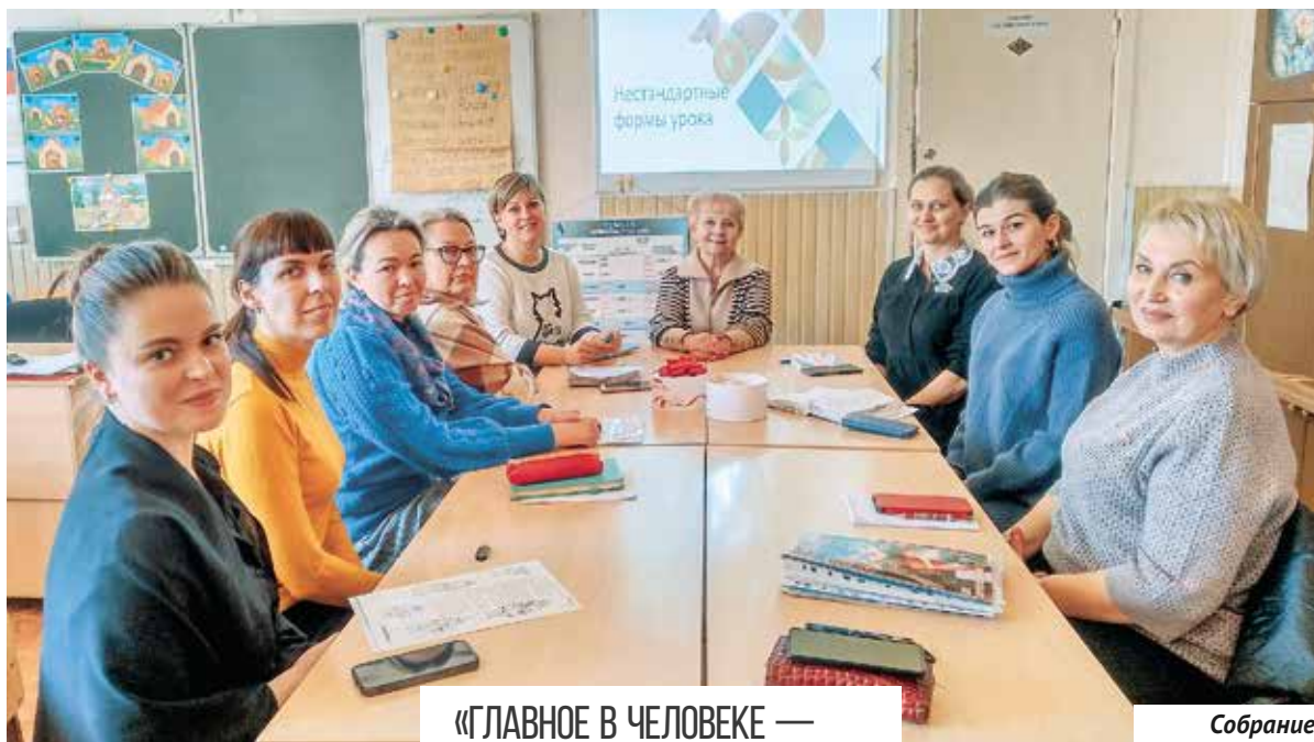
Собрание методического объединения

— На протяжении многих лет я руковожу педагогической практикой студентов СевГУ. В рамках Года