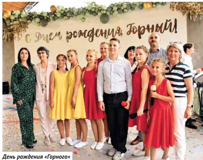
День рождения «Горного»

многие проносят через всю жизнь. А став взрослыми, вспоминают лето в лагере, как лучшее лето.