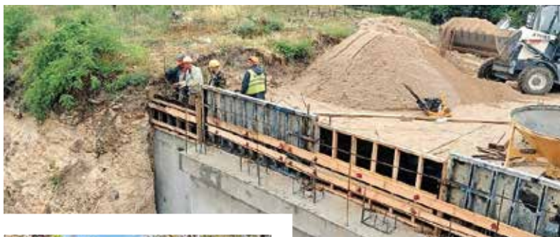
Капремонт путепровода на Госпитальном спуске