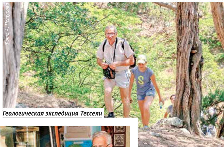
Геологическая экспедиция Тессели

— Вы знаете, я занимаюсь туризмом порядка пятидесяти лет. Конечно, за это время накопилась масса интереснейших историй.