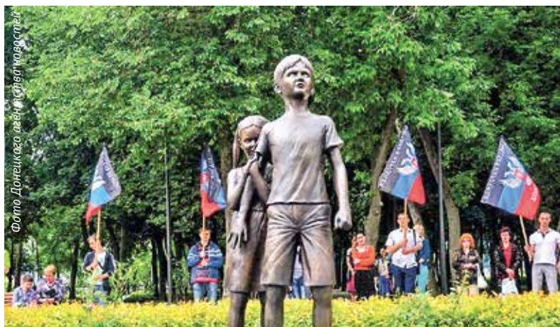
Памятник «Детям Донбасса»

11 июля 2022 года глава Донецкой Народной Республики Денис Пушилин подписал указ № 375 «Об установлении памятной даты». Траурным днём было объявлено 27 июля. Каждый год в этот день чтят память безвременно ушедших детей, которых забрала война, развязанная киевским режимом в Донбассе.