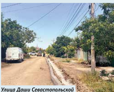
Улица Даши Севастопольской

Подробную информацию по всем объектам ремонта можно найти на интерактивной карте национального проекта: bkdrf.ru/map/sevastopol .