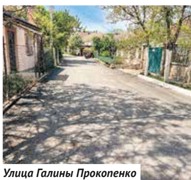
Улица Галины Прокопенко

12 объектов, 9 из которых уже в стадии строительно-монтажных работ, и 3 объекта в стадии разработки проектно-сметной документации. В частности, работы на восьмом этапе трассы «Таврида» выполнены на 98,5%. В настоящее время завершается работа по устройству шумозащитных экранов на транспортной развязке, а также укреплению русла реки Чёрной