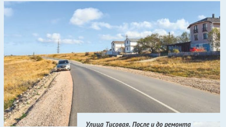
Улица Тисовая. После и до ремонта

Жители садовых товариществ в балке Бермана комфортную дорогу ждали очень долго. В 2021 году в рамках нацпроекта «Безопасные качественные дороги» завершился ремонт улицы Тисовой. Благоустроенная дорога связала Балаклавское шоссе и более 20-ти садовых товариществ. А ещё здесь проходит маршрут общественного транспорта до крупной транспортной развязки — 5-го км Балаклавского шоссе.