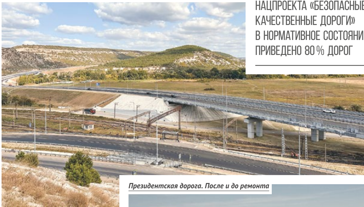
Президентская дорога. После и до ремонта

Президентская дорога. Это участок от границы с Бахчисарайским районом по автодороге «Симферополь — Бахчисарай — Севастополь» до 17-го км автодороги «Севастополь — Инкерман». Общая протяжённость пути — 13,25 километра.