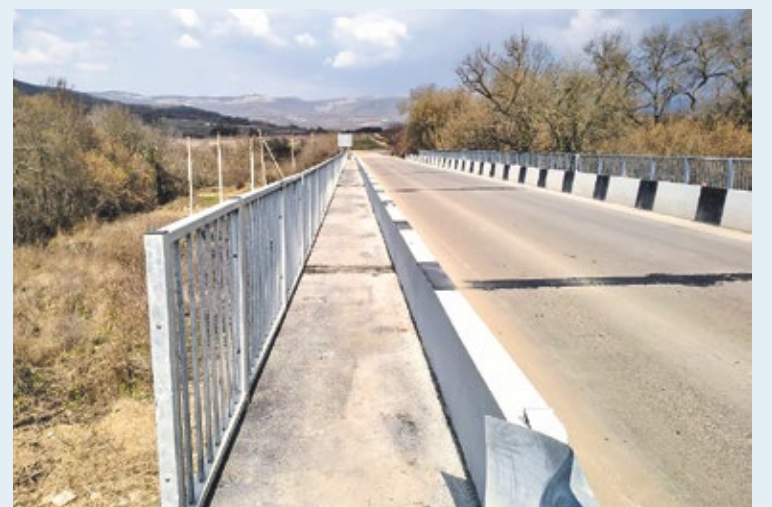
Мост через р. Чёрная. После и до ремонта

А вот жители сразу трёх сёл — Голубинка, Передовое и Широкое — долгое время ждали ремонт моста.