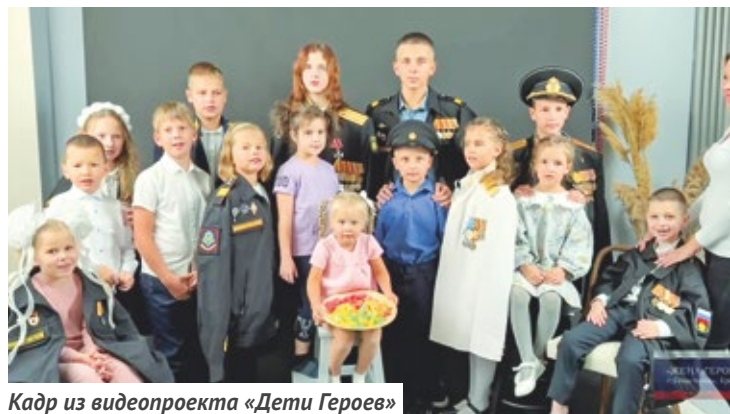
Кадр из видеопроекта «Дети Героев»