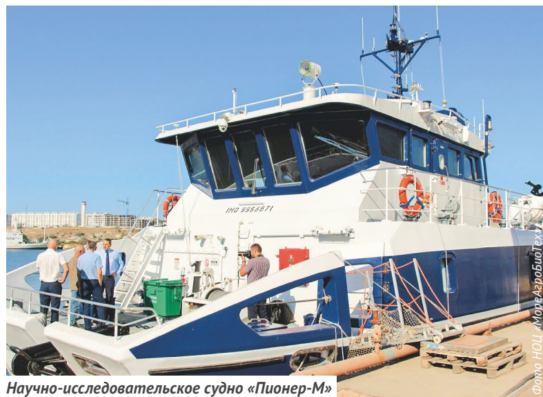
Научно-исследовательское судно «Пионер-М»

Технологический проект «Разработка и трансфер технологий морского «интернета вещей», экологического и климатического мониторинга» направлен на развитие отечественных автоматизированных измерительных комплексов контроля морской среды. «Интернетом