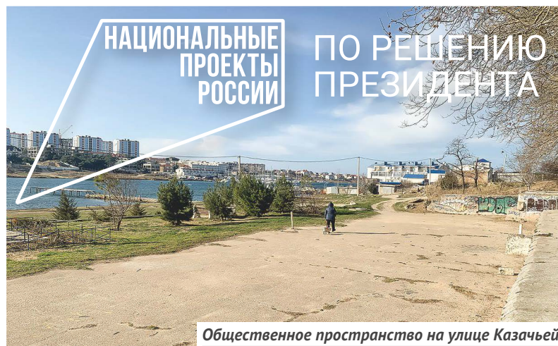
Общественное пространство на улице Казачьей

Глава муниципалитета отметил, что спокойные зелёные зоны на улицах Правды и Молодых Строителей отвечают на запросы старшего поколения района, мечтающего о местах для тихого время-