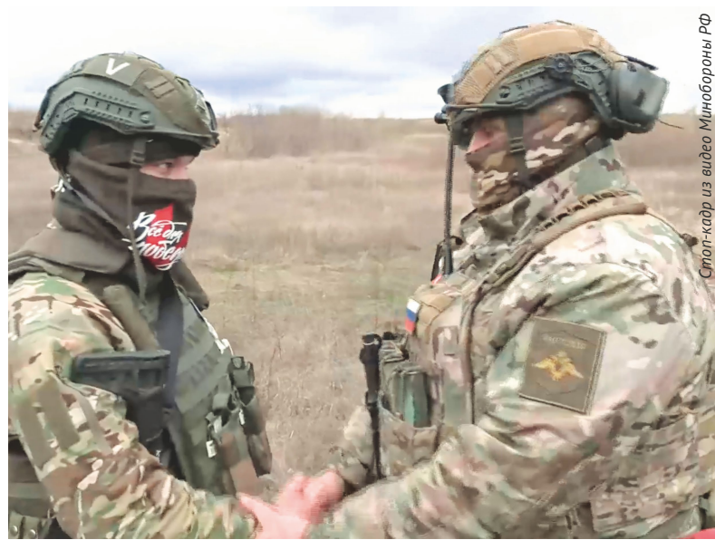
Стор-кадр из видео Минобороны РФ

По материалам пресс-службы Министерства обороны