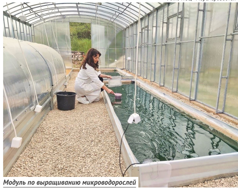
Модуль по выращиванию микроводорослей