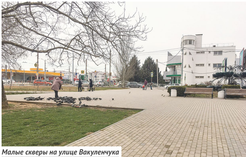
Малые скверы на улице Вакуленчука