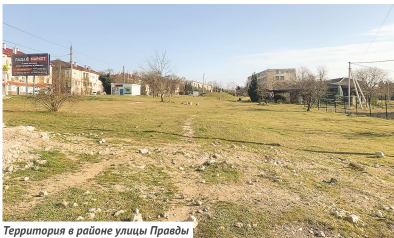
Территория в районе улицы Правды