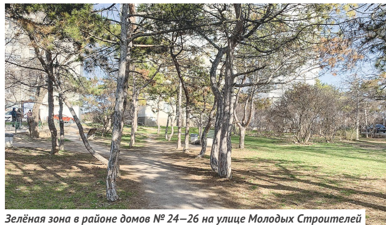
Зелёная зона в районе домов №24–26 на улице Молодых Строителей

шой потенциал, здесь красивый вид, рядом море, уже есть деревья, которые создают ландшафт. Кстати, эта территория была на втором месте в голосовании за объекты благоустройства прошлого года, за неё проголосовали более 2000 жителей.