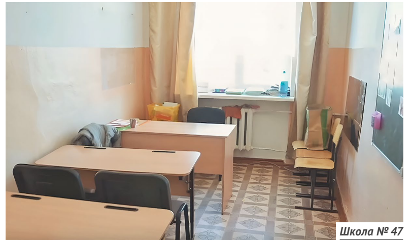
Школа № 47

Школа № 4 (ул. Флагманская, 2). Здание 1976 года. Чтобы в школе помещались все ученики — а их 955, — учителя переоборудовали под классы все воз-