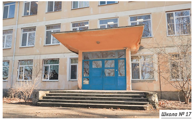
Школа № 17

Школа № 17 (Сахарная Головка, ул. Тимирязева, 1). Здание 1953 года постройки. Центральный вход с крыльцом аварийный, его уже закрыли, ученики пользуются другими входами в здание. Школу подтапливают грунтовые воды, коммуникации устарели, в мастерской обветшала кровля. Также планируется благоустроить территорию.