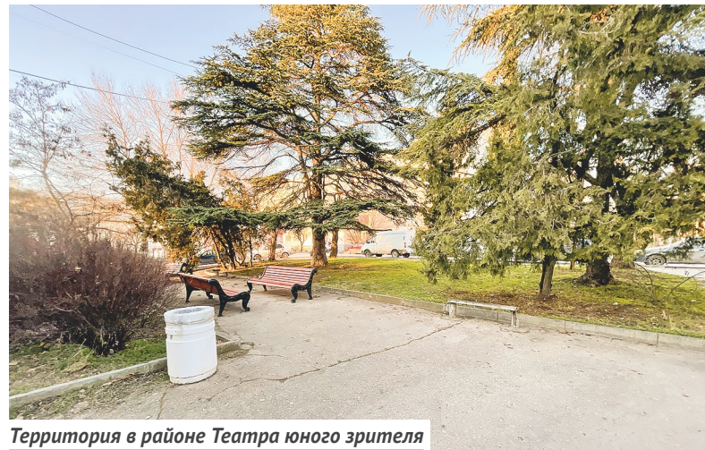
Территория в районе Театра юного зрителя