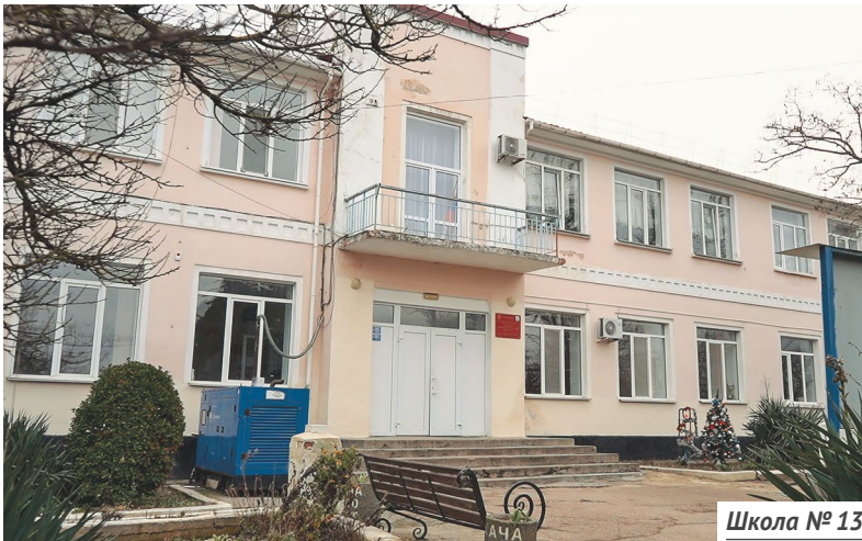
Школа № 13

можные помещения. Кроме того, здесь протекает кровля, обветшал фасад. Большую территорию школы — 27 тыс. кв. м — нужно сделать максимально функциональной.