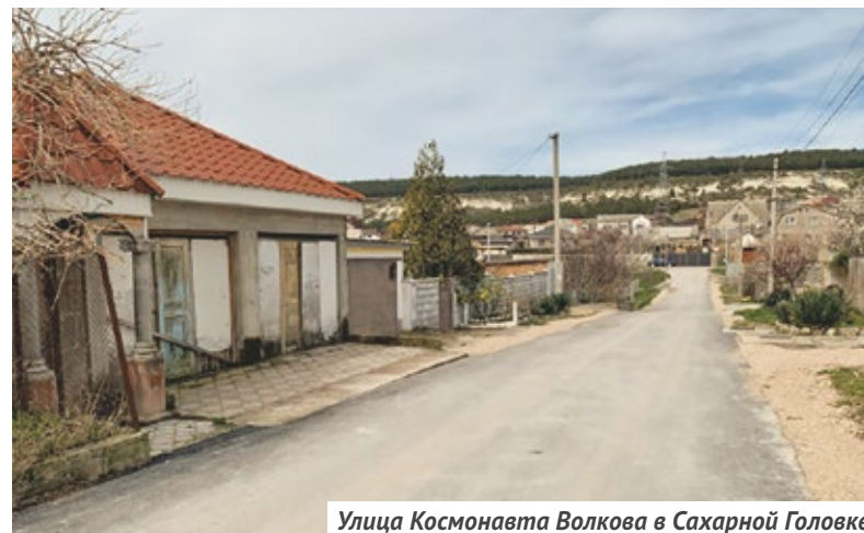
Улица Космонавта Волкова в Сахарной Головке

Подробная информация по всем объектам ремонта доступна на интерактивной карте национального проекта: bkdrf.ru/map/sevastopol .