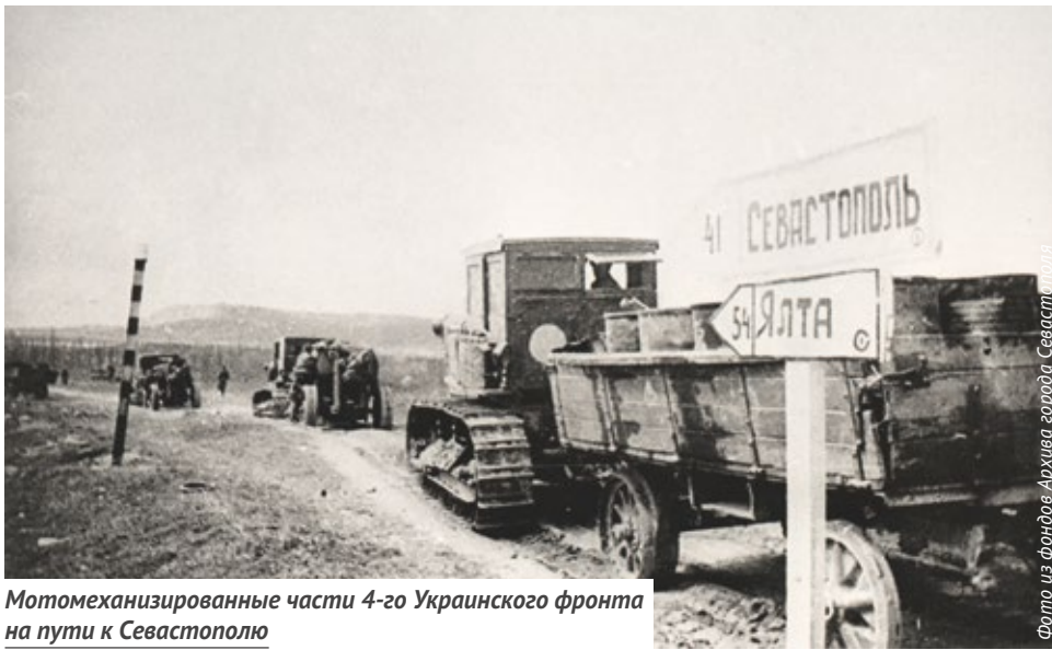
Мотомеханизированные части 4-го Украинского фронта на пути к Севастополю