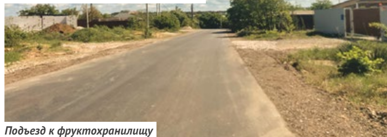
Подъезд к фруктохранилищу