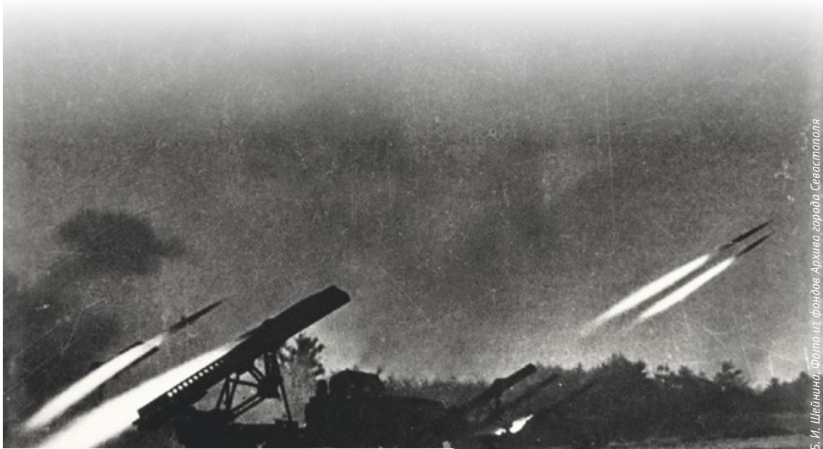
Залп дивизиона гвардейских миномётных установок БМ 31-16 по позициям противника под Сапун-горой