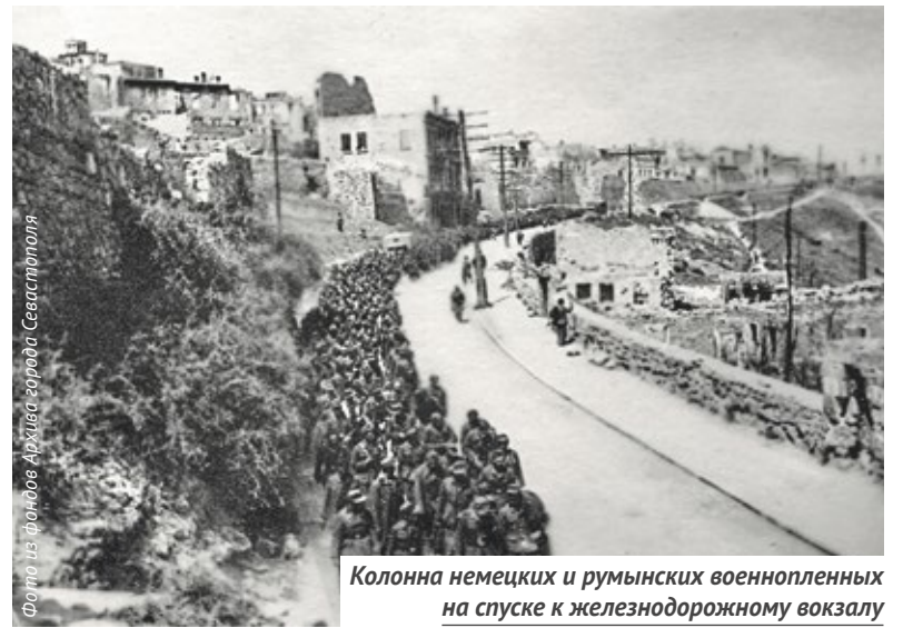
Колонна немецких и румынских военнопленных на спуске к железнодорожному вокзалу